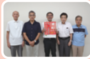
▲区民まつり実行委員会の皆様と

浦和北公園会場、市場通り・常盤公園会場、浦和駅周辺会場、調公園会場ともに、おいしいもの、楽しいイベントをご用意してお待ちしていますので、ぜひお越しください。