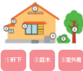
巣が作られやすい場所