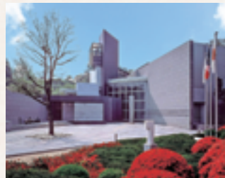
▲笠間日動美術館(茨城県笠間市)