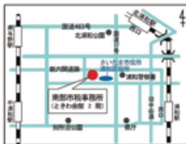
詳しくは、全市版P6をご覧ください。

所得税(国税)の確定申告については浦和税務署(TEL 600・5400)にお問い合わせください。