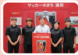
▲三菱重工浦和レッズレディースの選手の方々と