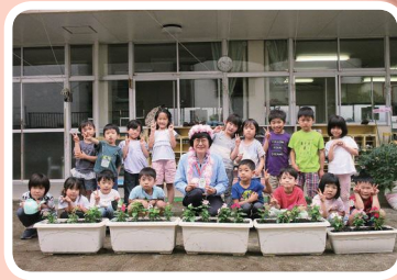
▲東仲町保育園の皆さんと一緒にニチニチソウを植えました。

区では、緑豊かな美しい街並みを創出するまちづくりの一環として、ボランティアの方々と協働で花の植え替えを行なっております。駅周辺をはじめ、街角でニチニチソウの可愛い花を見かけたら、ぜひ目を留めていただければと思います。