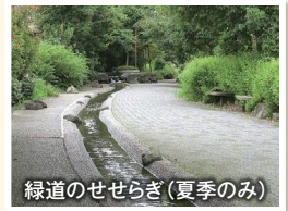
緑道のせせらぎ(夏季のみ)

大きなクスノキが目印の領家2丁目公園の南から本太中学校手前までが天王川コミュニティ緑道で、敷石がゆるやかな水路のカーブを作り、人工的ではありませんが小さなせせらぎと魚やカエル、カワセミなどがウォーキング途中の癒しになります。両側にクヌギやコナラなどの木々が植えられちょっとした森林浴。四季折々の花々や元町東公園沿いの桜並木も見どころです。