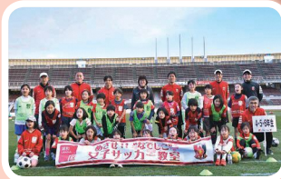
▲未来の“なでしこ”の皆さんと

本取り組みは、毎年たくさん子どもたちが参加し、サッカーを楽しみながらレベルアップ指導を受けています。「サッカーのまち浦和」から未来の“なでしこ”の誕生を心待ちにしています。