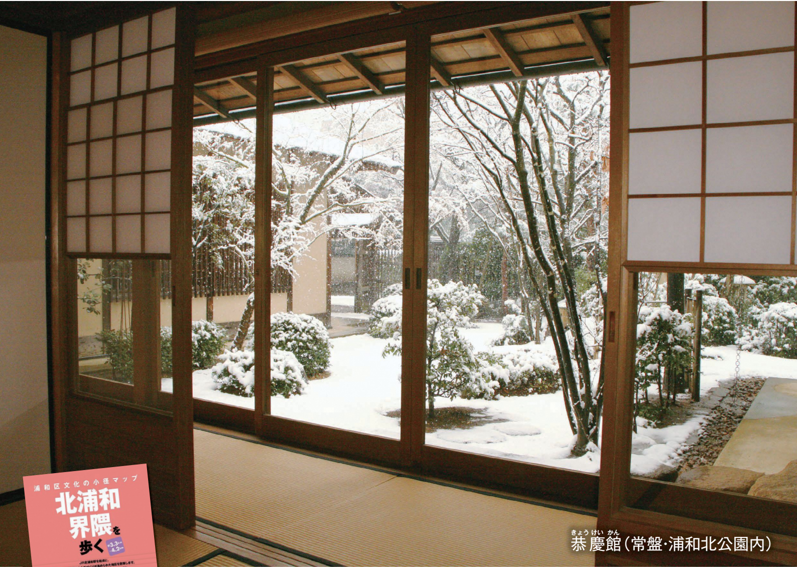
きょうけい かん 恭慶館 (常盤・浦和北公園内)

【新型コロナウイルスの影響により、事業内容が変更になる場合があります。詳しくは、市ホームページや各問合せ先へ。】