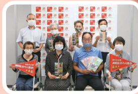
浦和区文化の小径づくり推進委員会の皆さんと

秋風の心地よいこの季節、小径マップを片手に、浦和区の魅力を再発見してみたいはいかがでしょうか。