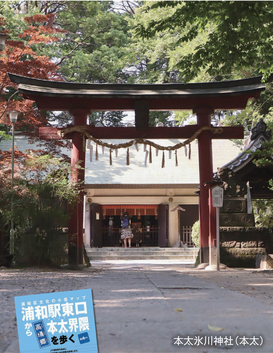
本太氷川神社(本太)

【新型コロナウイルスの影響により、事業内容が変更になる場合があります。詳しくは、市ホームページや各問合せ先へ。】