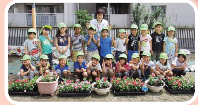
▲常盤北保育園の皆さんと一緒にニチニチソウを植えました。

この時季、マスク着用による「熱中症」に注意が必要です。高温や多湿といった状況でのマスク着用は、熱中症のリスクが高くなるおそれがあります。新しい生活様式における熱中症予防行動のポイントとして、屋外で人と十分な距離が確保できる場合には、マスクをはずすようにしましょう。また、周囲の人との距離を十分にとれる場所で、マスクを一時的にはずして休憩することも必要です。日頃から体温測定を行うなど健康管理に努め、暑い夏を元気に乗り越えましょう。さて、写真は6月中旬、区内保育園の園児たちと一緒に、区の花「ニチニチソウ」の花植えを行った時のものです。元気いっぱいな園児たちと、花に親しむ時間を楽しみました。園児の皆さん、ニチニチソウの花言葉である「楽しい思い出」をたくさん作ってくださいね。