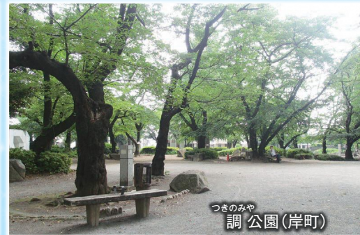
つきのみや 調公園(岸町)