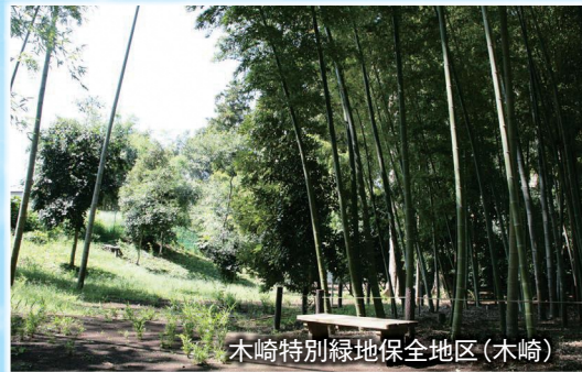
木崎特別緑地保全地区(木崎)