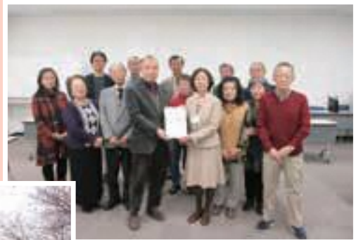
▲第8期浦和区区民会議「平成30年度協議結果報告書」を受け取りました。今後の区政の参考にさせていただきます。

さて、表紙でご案内しているとおり、今月は「浦和うなぎまつり」が市役所で開催されます。「浦和のうなぎ」には約200年の歴史があり、江戸時代沼地が多かった浦和で捕れたうなぎを「蒲焼」にし中山道を行き来する人にふるまったことで、味の良さが評判となりました。伝統の味、伝統的な技術がしっかりと受け継がれている「うなぎ弁当」を食べてみてはいかがでしょうか。お子様から大人まで楽しめるイベントですので、是非足をお運びください。