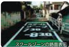
スクールゾーンの路面表示