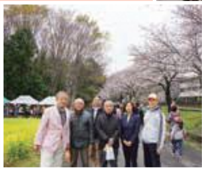
◀3月31日に開催された見沼桜まつりにて