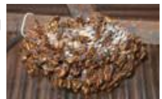
大きく成長した蜂の巣(8月頃)