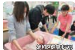
浦和区健康まつり

詳細を掲載した区長マニフェストは、区役所情報公開コーナー、区内の公民館、区内各駅市民の窓口で配布しています。また、区のホームページにも公開していますので、ぜひご覧ください。