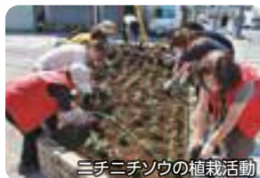
三子ニチソウの植栽活動