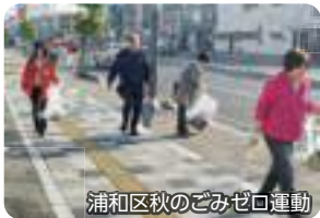
浦和区秋のごみゼロ運動