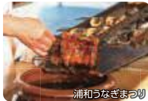
浦和うなぎまつり