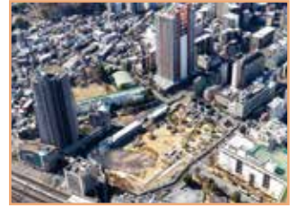
浦和駅西口南高砂地区市街地再開発事業