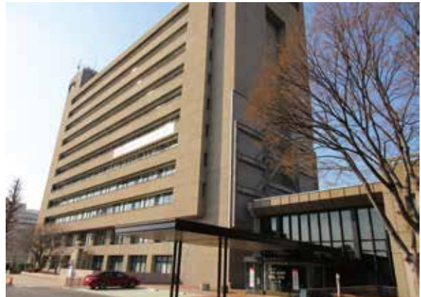
祝 浦和区役所 20周年