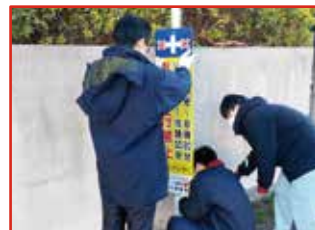
未来(みら)くるワーク体験

目標 アンケートで「仕事をするのは人の役に立つことだと思う」の割合増加数 12.8ポイント