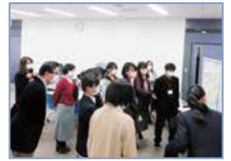
浦和ネクストステージプロジェクト

目標 アンケートで「浦和区の将来像やまちづくりについて考えるきっかけになった」と回答した参加者の割合 70%以上