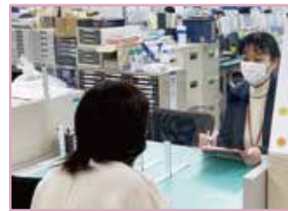
福祉まるごと相談窓口