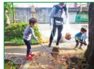
浦和区秋のごみゼロ運動