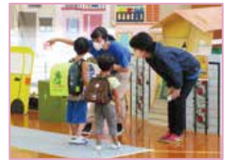
浦和区親子防犯教室

目標 講演会・教室あわせて、アンケートで「防犯意識が向上した」90%以上 特殊詐欺防止啓発活動対象者数 1,000人