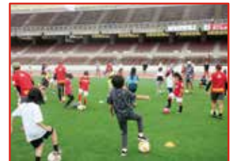
女子サッカー教室