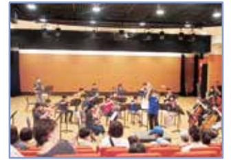
わくわく浦和区フェスティバル