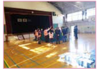
区避難所運営訓練