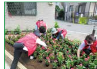
ニチニチソウの植栽活動

目標 イベントやSNSなどで区の花「ニチニチソウ」のPRを実施 アンケートによる認知度 50%以上