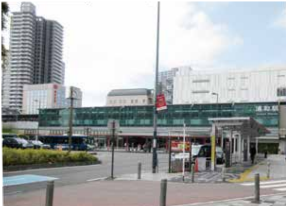
祝 浦和駅開業 140周年