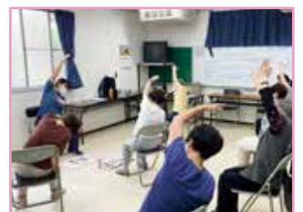
ますます元気教室