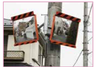
道路反射鏡の設置例

目標 道路照明施設(公衆街路灯)の設置数 600灯(市全域) 道路反射鏡の設置数 250基(市全域)