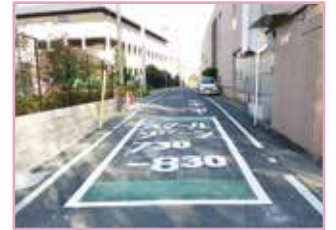
スクールゾーンの路面表示

目標 交通安全ワークブックの配布 区内を学区とする小学1年生 路面表示等の実施 区内の小学校4校