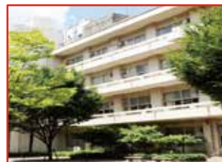
市立浦和高等学校