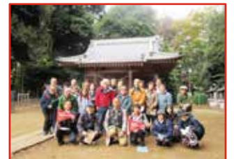
ウォーキングイベント