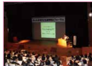
子ども虐待防止フォーラム

目標 子ども虐待防止フォーラム参加者のうち「参考になった」90%以上 市内におけるハローエンゼル訪問の実施率 95%以上