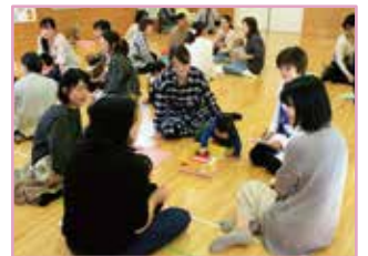
子育て応援サロン