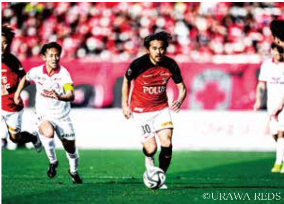
浦和駒場スタジアムで戦う浦和レッズ