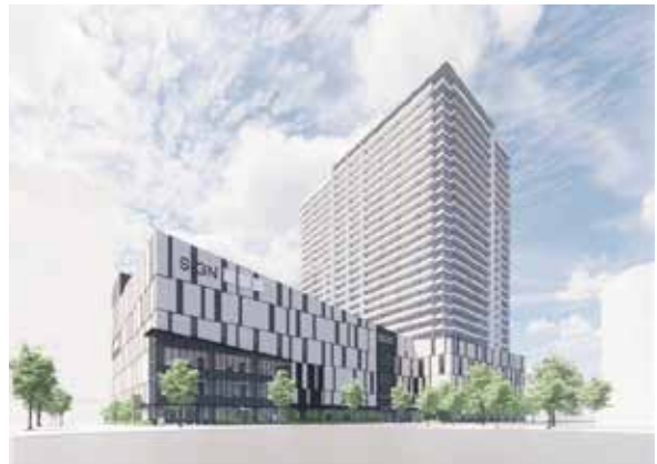
浦和駅西口南高砂地区市街地 再開発事業（完成後イメージ）