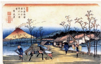
▲木曾街道六十九次のうち浦和宿の版画(英泉画) (浦和宿)

江戸時代に中山道が整備され、浦和宿は日本橋を出て3番目の宿場になりました。本陣1軒、脇本陣3軒、旅籠15軒、家数200軒余り、宿の長さ約2キロ、街並み約1キロ、1,230人ほどが暮らしていました。