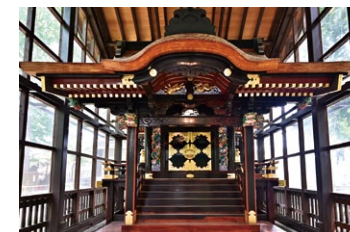
▲調神社の稲荷社(旧本殿)

稲荷社(旧本殿)は享保18年(1733)に造営されたことが内部に残された木札から分かっています。平成25年から29年度にかけて元の姿に修復されました。正面、脇障子の兎の彫刻など見事なものです。