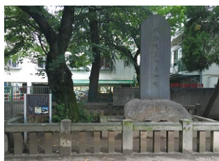
▲浦和宿本陣跡にある明治天皇行在所の石碑

江戸時代に中山道が整備され、浦和宿は日本橋を出て3番目の宿場になりました。本陣1軒、脇本陣3軒、旅籠15軒、家数200軒余り、宿の長さ約2キロ、街並み約1キロ、1,230人ほどが暮らしていました。