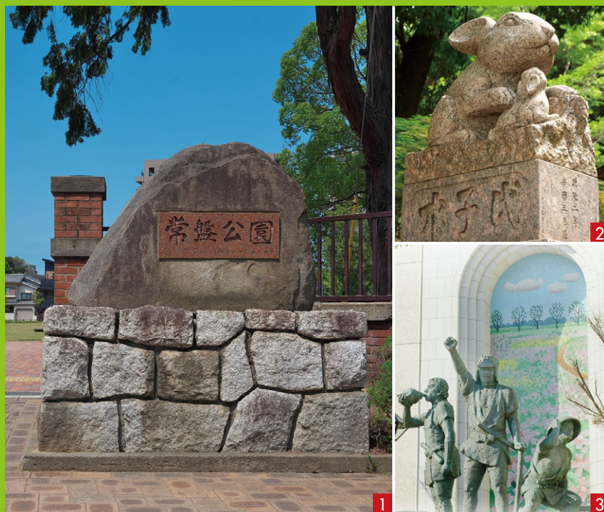
1 常盤公園 2 調神社の兎像 3 桜草自生地の風景(高田誠原画)と武者群像

JR浦和駅を起点に、江戸時代30余りの大名による参勤交代が行き交った中山道浦和宿を散策します。街道沿いにひっそりと残る史跡や寺社、新しい浦和の街並みなどを探訪します。初版発行日…平成19年(2007)3月 編集・発行…浦和区文化の小径づくり推進委員会