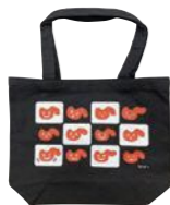
黒地バッグ W340×H260×マチ100mm (本体サイズ)