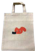
ナチュラル白バッグ W260×H330mm (本体サイズ)

うらわ美術館教育普及用キャラクター「うらび」のトートバッグを販売しています。 リニューアル・オープン後、ぜひご覧ください。