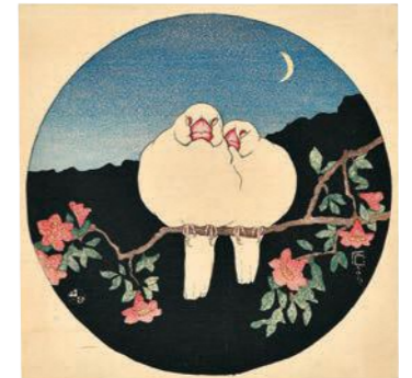
フリッツ・カベラリ《石榴に白鳥》大正4年(1915)