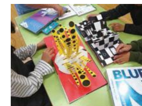
本の出張授業の様子

※学校向けに、造形的な本や埼玉アートカードセット等の鑑賞ツールの貸出も行っています。