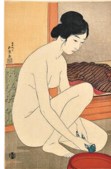
橋口五葉《浴場の女》大正4年(1915)

本展では、庄三郎の精神を今なお受け継ぐ渡邊木版美術画舗の全面的な協力のもと、残存数が少なく貴重な初摺の渡邊版をとおして、庄三郎の挑戦の軌跡を辿りつつ、モダンな精神と華麗な表現に彩られた「新版画」作品の数々を紹介します。