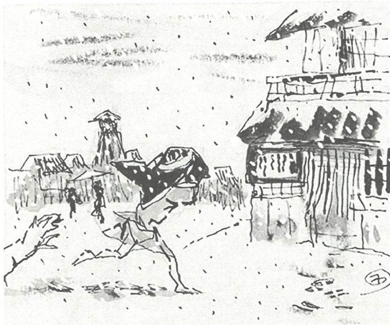
木村莊八「『名作聞書』挿絵」1955年 うらわ美術館