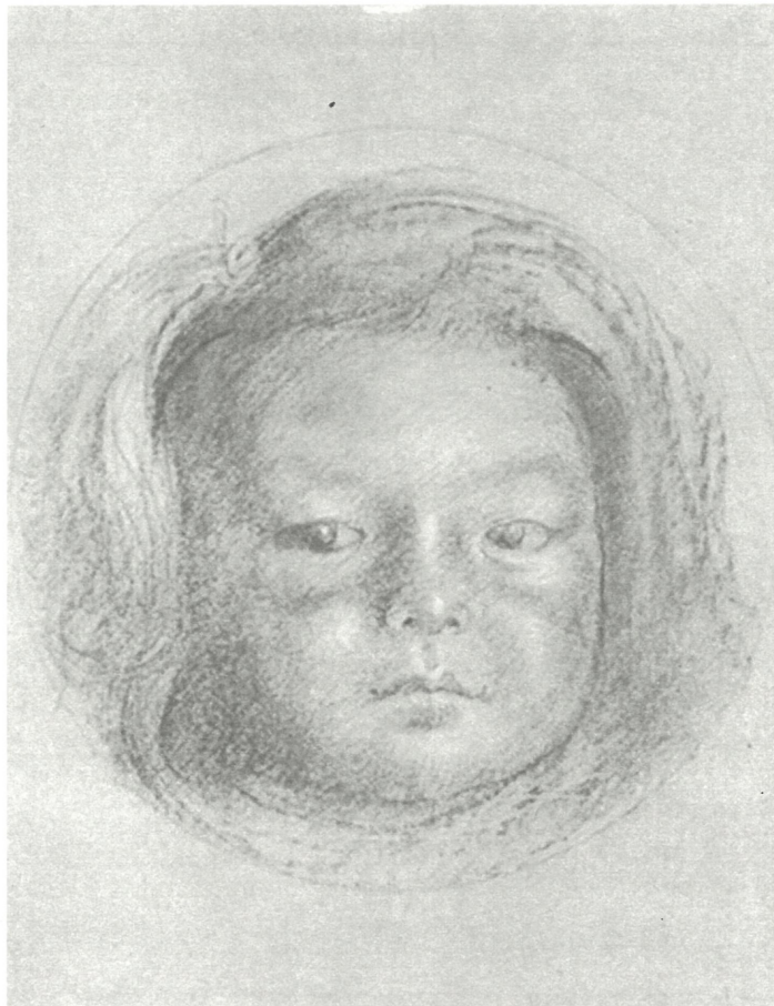
岸田劉生《麗子之蔵》1918年 笠間日動美術館蔵

そ 素描とは、外国の言葉で「デッサン」や「ドローイング」とも言う、えんぴつや木炭など主に単色の線で描かれた絵の事です。一見シンプルで色もあまりありませんが、これもれっきとした作品です。