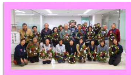
作品と一緒に記念撮影！