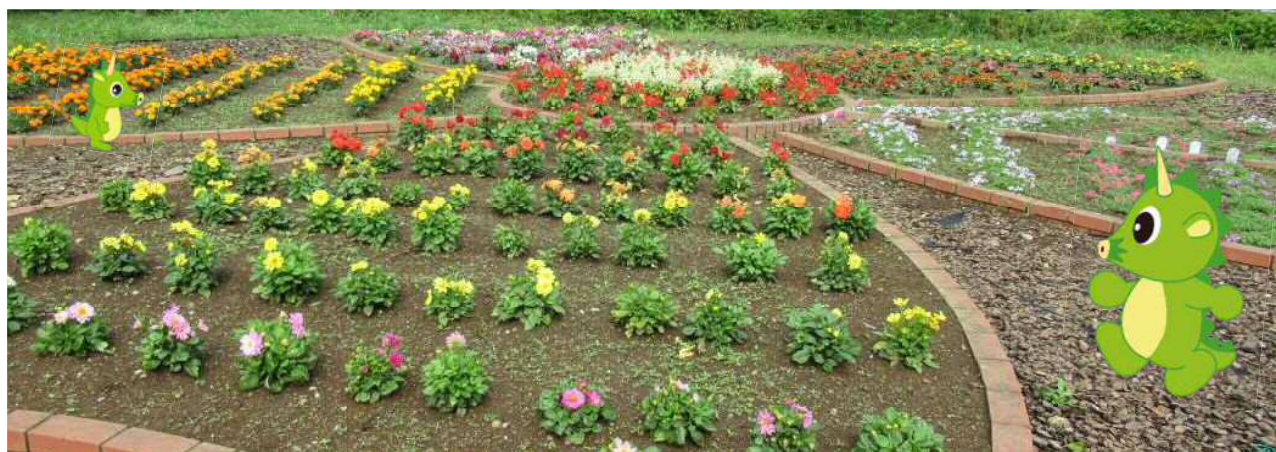
桜区花と緑ふれあい広場（区役所北側の花壇）