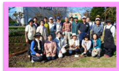
植え付けた花壇の前にて♪