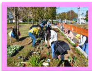
花壇での活動（花の植え付け）