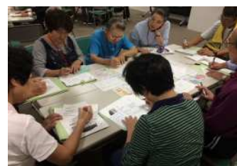
地域資源のグループワーク