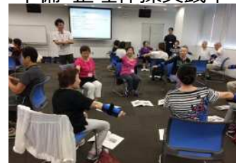
いきいき百歳体操実践中