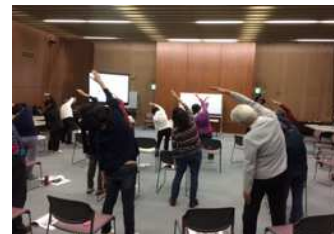
準備・整理体操実践中