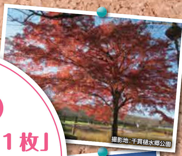
撮影地:千貫樋水郷公園