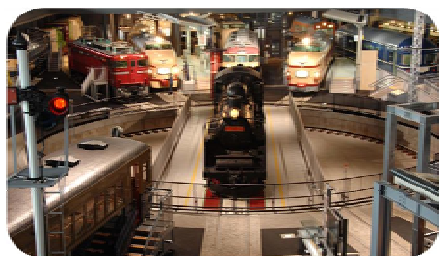
入館者数500万人を達成した 「鉄道博物館」