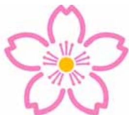
大宮区の花 さくら