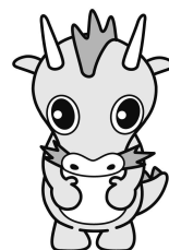
さいたま市PRキャラクター つなが竜又ウ

『令和2年度 さいたま市 大宮区 区長マニフェスト評価書』 をご覧いただきありがとうございました。 この評価書は、皆様の貴重なご意見などを基につくることができました。 アンケートにご協力いただいた方々に、厚く感謝申し上げます。