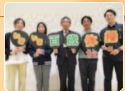
シニアサポートセンターの地域支え合い推進員、理学療法士の皆さんと