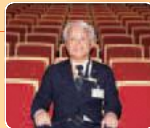
小ホール客席にて

市民会館おおみや「RaiBoC Hall (レイボック ホール)」をぜひご利用ください。