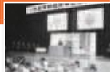
大宮市制30周年記念式典 (S45.11.3)