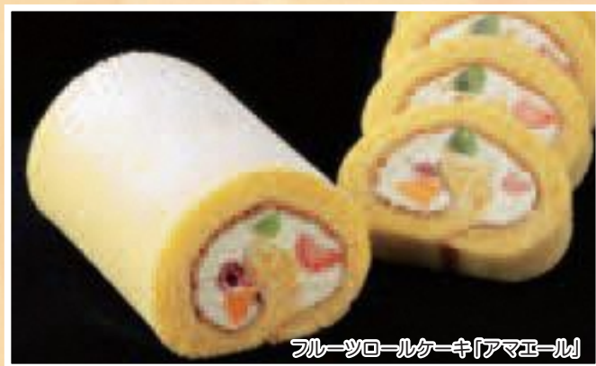
フルーツロールケーキ「アマユール」