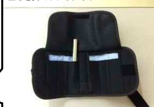
重さを変えられるおもりバンド