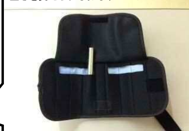
重さを変えられるおもりバンド