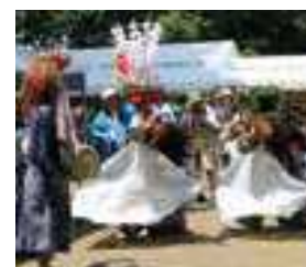
3頭の獅子が勇壮華麗な舞いを披露