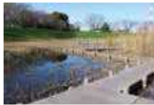
鴨川ウェットランド