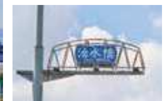
電灯には昔のトラス橋がデザインされている