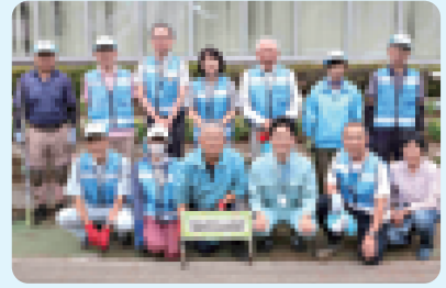
▲堀崎町自治会環境部の皆さんと区役所前花壇の植栽を行いました(区長前列右から3番目)