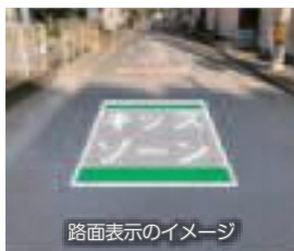
路面表示のイメージ