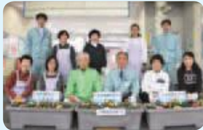
大和田駅で植栽を行いました▲