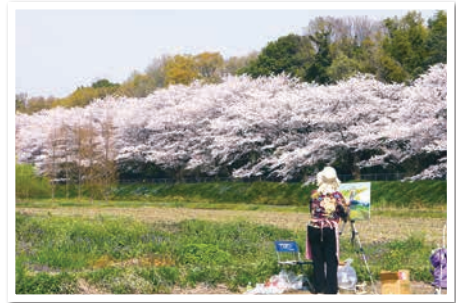
～私の好きな見沼たんぼ写真コンクール作品～