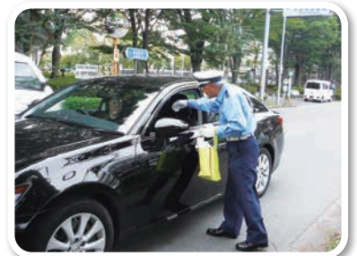
交通安全啓発活動