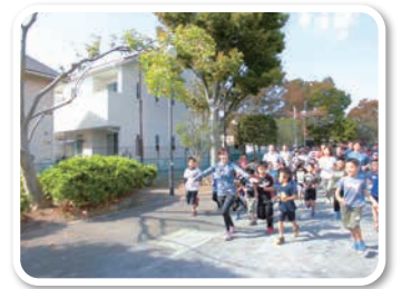
親子でトライ!! らんらん♪ランニング