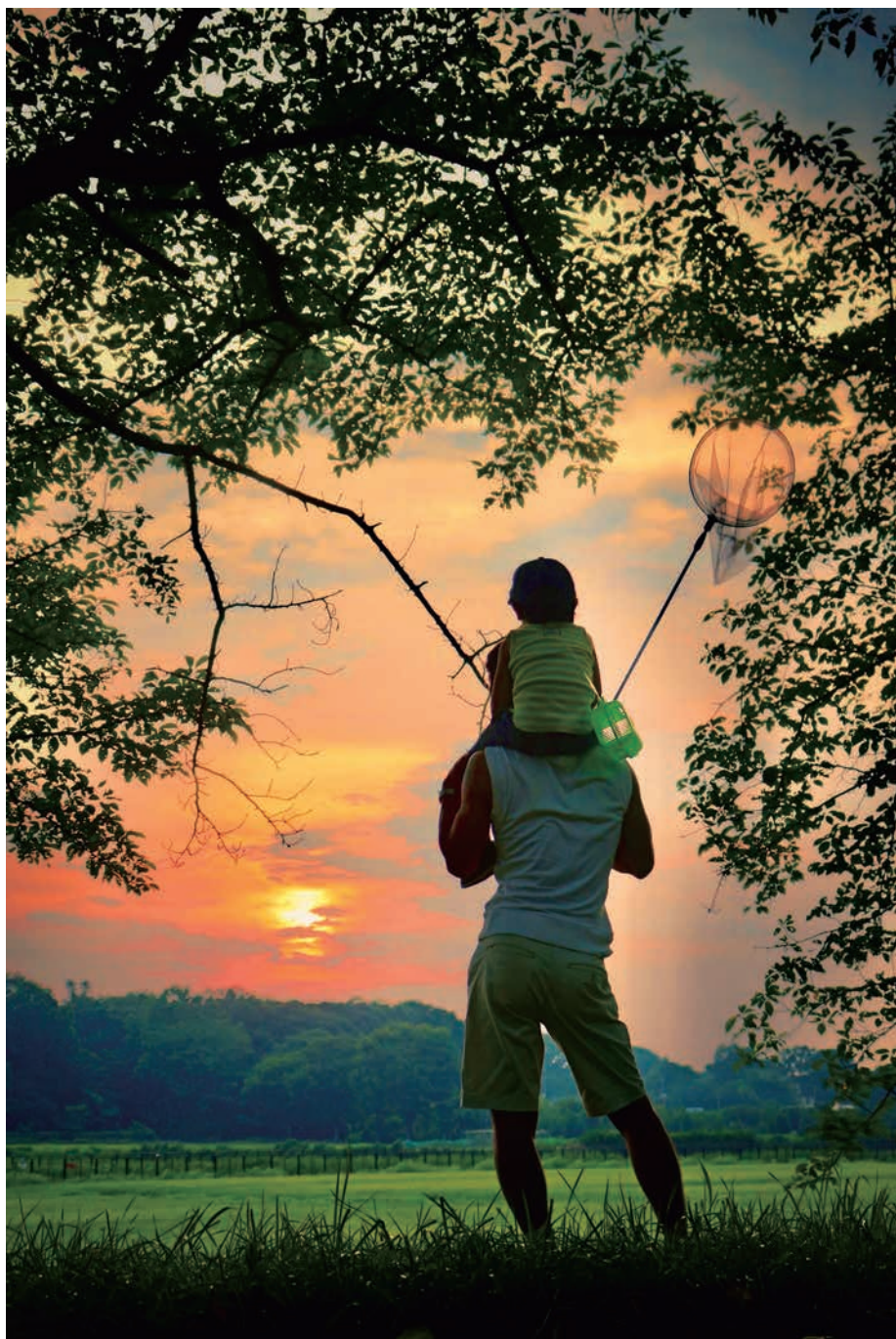
〜私の好きな見沼たんぼ写真コンクール作品〜