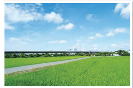
～私の好きな見沼たんぼ写真コンクール作品～