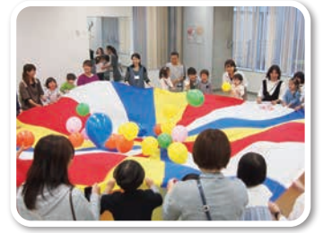
ふれあい Cafe みぬま