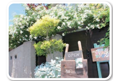
オープンガーデン