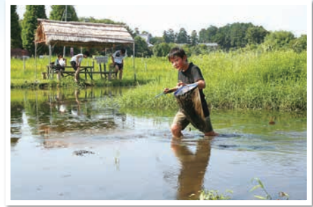
～私の好きな見沼たんぼ写真コンクール作品～