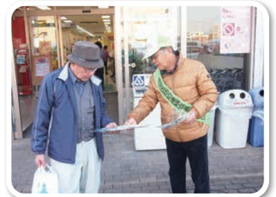
協働による防犯啓発活動