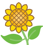
南区の花 ヒマワリ

区の色であるレモン色にちなんで選ばれたヒマワリは、区の色と同様に花の特徴が南区の若々しいイメージにあっている花です。