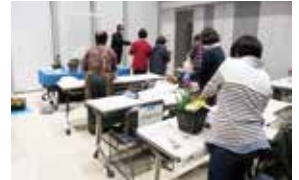
ガーデニング教室

民有地の緑化に積極的に取り組み、緑を増やすため、季節の花等を題材に、プランターを活用したガーデニング教室を開催します。