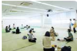
みなみっこクラブ

育児中の保護者が、生後2・3か月の早い時期に必要な知識を習得するとともに、地域での仲間づくりができるよう、全乳児とその保護者を対象に育児学級「みなみっこクラブ」を開催します。