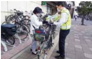
武蔵浦和駅前街頭キャンペーン