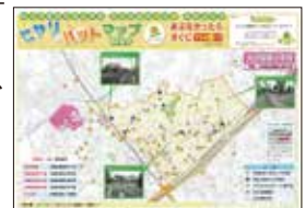
小学生ヒヤリハットマップ