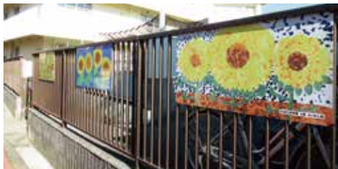
ヒマワリ絵画パネル