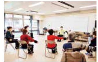
ますます元気教室

また、「すこやか運動教室」等に地域運動支援員※を派遣し、体操を活用した介護予防を進めます。