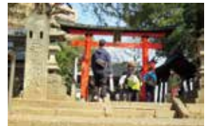
ウォーキングイベント

歴史ある地域資源など、区の魅力を発見するとともに、参加者間の交流や健康づくりを進めるため、ウォーキングイベントを開催します。