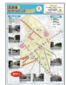
高齢者ヒヤリハットマップ