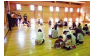
ヒマワリミーティング

区の特徴あるまちづくりを進めるため、広く区民から意見等を聴取する機会として「ヒマワリミーティング」を開催します。