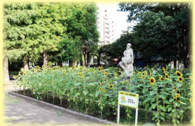
ヒマワリスポット・別所沼公園