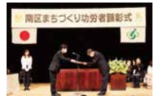
南区まちづくり功労者顕彰式

長く地域の発展を支えてこられた方々の功績を讃えるため、顕彰式典を開催し、感謝状を贈呈します。