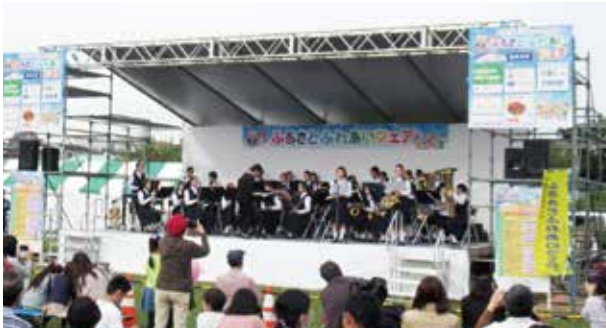
ふれあいステージ