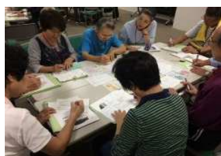
地域資源のグループワーク