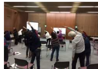
準備・整理体操実践中