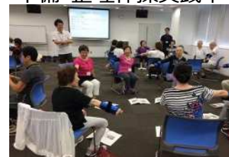
いきいき百歳体操実践中