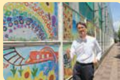
ヒマワリ通りでウォーキング