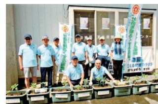
更生保護サポートセンター 前でヒマワリの植栽を実施