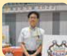
9月開催の防災展にて ※撮影のため、マスクをはずしています。