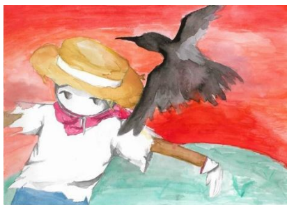
絵画 小学生高学年の部 「感情のあるかかし」