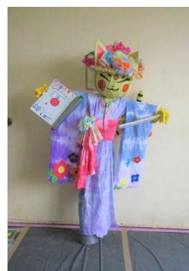
かかし部門 「まもりネコのかかし」