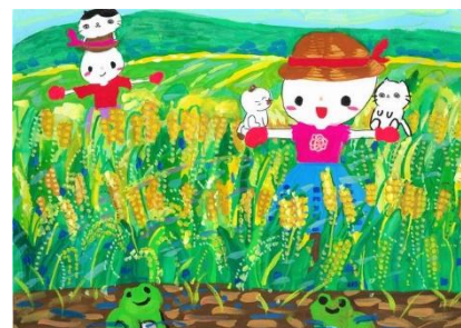
絵画 小学生低学年の部 「ねこたちもかかしのお仕事手つだいます！」