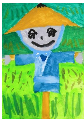
絵画 中学生の部 「田んぼにいるかかし」