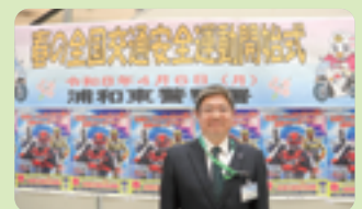
▲春の全国交通安全運動開始式にて

結びに、日頃から子どもたちの登下校を見守ってくださる交通指導員、防犯ボランティア、保護者、学校関係者をはじめとする地域の皆さんのご尽力に深く感謝申し上げます。引き続き、ご理解とご協力を賜りますようお願い申し上げます。