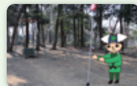
▲お子さんに人気のターザンロープ

さぎ山記念公園は自然豊かで様々な遊びを楽しむことができます。遊具ではターザンロープが特に人気です。修景池では大人はヘラブナ釣り、お子さんは水辺の魚や生き物観察などを楽しんでいます。 これから遊具を新しくしたりキャンプ場や園内で使用するレンタルグッズを充実するなど、更に快適に過ごしていただけるよう整備を進めていきます。