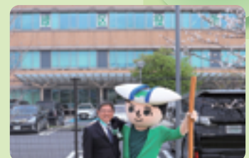
▲緑太郎*と緑区役所前にて ※緑区マスコットキャラクター

また、区政推進のため、「令和8年度 緑区のまちづくり」を策定しました。緑区の特徴を生かし、魅力あるまちづくりに職員一同、励んでまいりますので、ご支援・ご協力をよろしくお願いいたします。