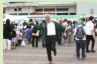
▲緑区区民まつりにて

2025年もあとわずかとなりました。今年も、区政にご理解、ご協力をいただきましたことを心より感謝申し上げます。冷え込む時期となりますので、どうぞご自愛のうえ、良いお年をお迎えください。