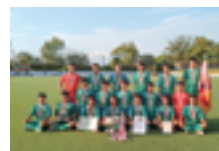
▲サッカー部 関東大会優勝の集合写真

地域の皆さんから多くのご支援ご声援をいただいたことが、生徒たちの励みになり、活躍の原動力となっています。