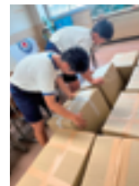
▲集めた服を 梱包している様子