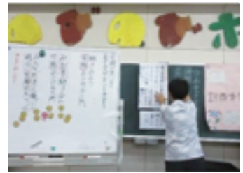
▲「大門小のめあて」を話し合う様子

めあての達成に向けて、各委員会によるキャンペーン活動や異学年交流等、さまざまなことに取り組んでいます。