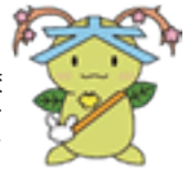
大門小学校 キャラクター “だいモン”▶

そして、“ハッピーファーム”と呼ばれている広い畑や田では、野菜や植物を育てており、理科や生活科の学習に活かしています。5年生では、地元の方を講師に招き田植えや稲刈り体験を行うなど、地域とのつながりを大切にしています。その他にも、6年生では約13.5kmを踏破する「日光御成道チャレンジ強歩」を実施しています。今年で7回目を数え、毎年100名をこえる保護者・地域の方のサポートをいただき、励まし合って岩槻城址公園を目指します。