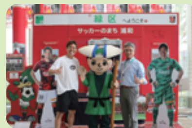
西川周作選手と区民ホールにて

また、区民まつりにも協力いただく浦和レッズに所属する西川周作選手が、夏を迎える少し前、区役所に来庁され、1階区民ホールに展示してある等身大パネルなどへサインを頂きました。区役所へお越しの際はご覧ください。