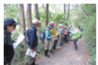
▲昨年度セミナー風景