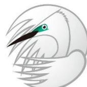
緑区の鳥 シラサギ