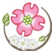
緑区の木 ハナミズキ