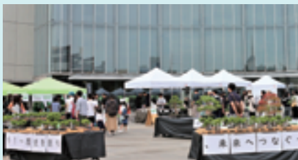
盆栽イベントの様子