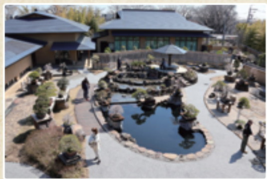
リニューアルした庭園