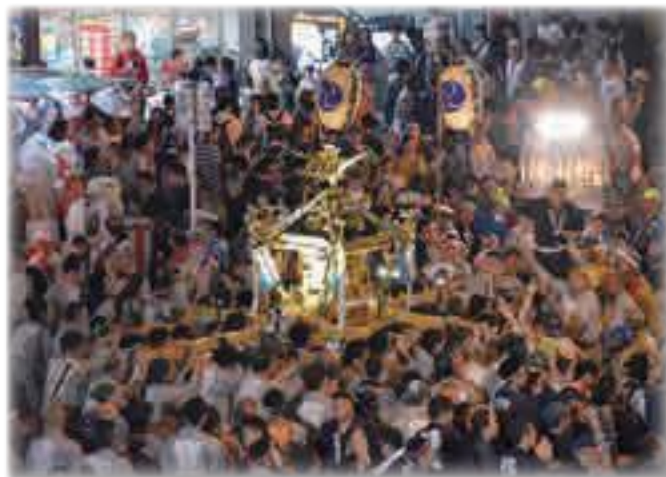
令和元年に開催されたときの様子

みやはらまつり」が開催されています。宮原地区内各所の祭礼で受け継がれてきた神輿や山車、曳き太鼓の数々が旧中山道を渡御します。そして、夜になると、神輿や山車などが東口広場に一堂に会し、祭りはクライマックスを迎えます。