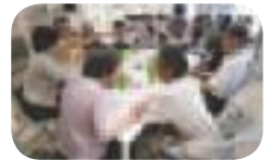
諏訪の苑での活動の様子

シニアサポートセンター(地域包括支援センター)諏訪の苑は、北区東部圏域(植竹地区、大砂土地区)で、高齢の方やそのご家族の介護や福祉、医療などに関する相談を受け付けています。また、子ども食堂やベビーカーコンサート等の子育て応援のボランティアなど、健康、生きがい、仲間づくりの活動にも取り組んでいます。