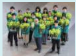
菜の花の造花を手にして、北区役所職員と記念の1枚

北区役所では、北区の花「菜の花」のロゴマークや造花などを活用し、区民の皆さんに親しんでいただけるよう努めています。そうした取組の一つとして、皆さんが集い、ふれあいを深めていただけるよう、3月末ごろにプラザノース正面玄関前を飾るべく、北区役所職員が菜の花を育てています。その様子は、今月号の記事で紹介していますように、区ホームページなどでご覧いただけます。開花の状況をチェックしていただき、満開の菜の花を楽しんでいただければ幸いです。