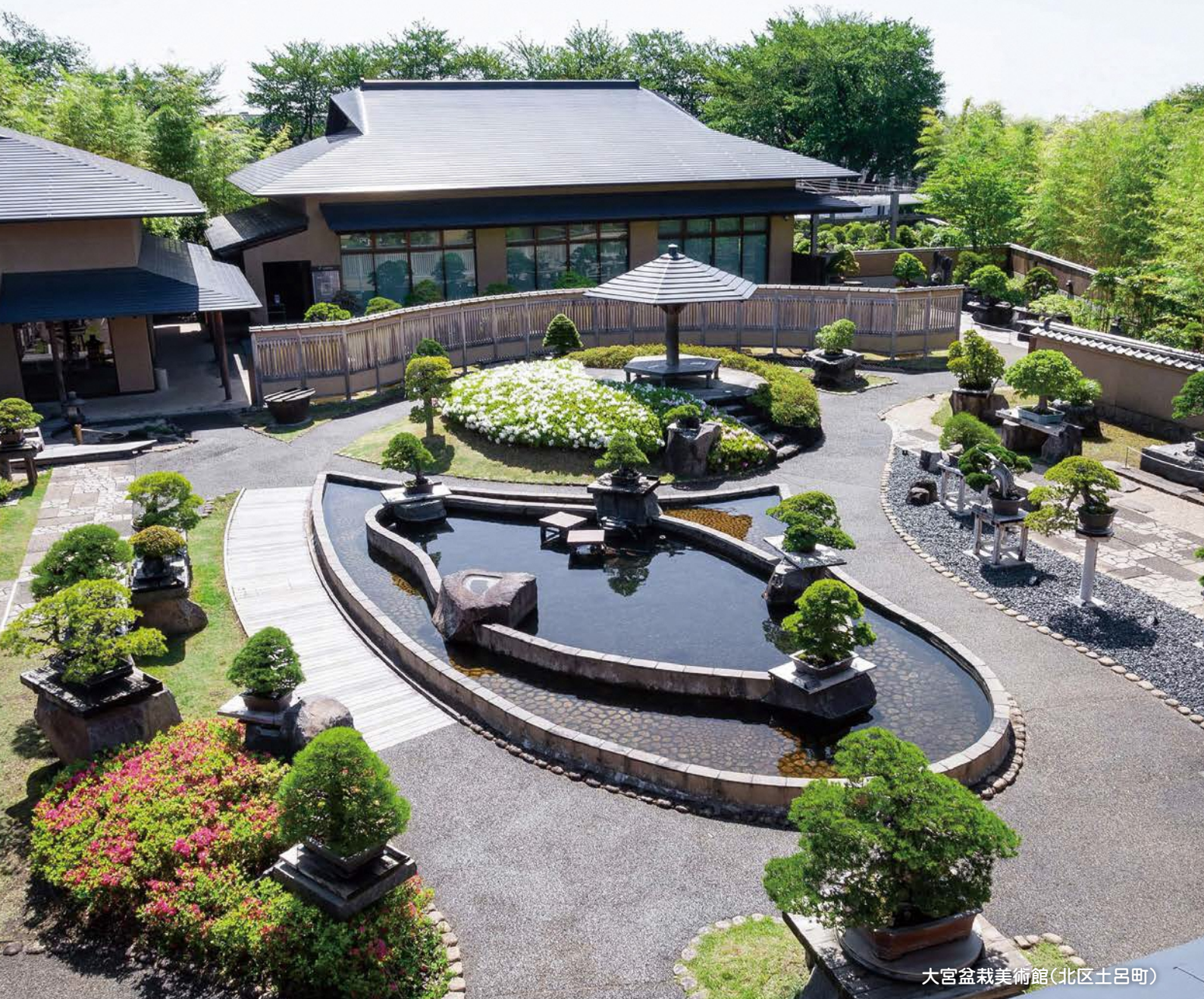
大宮盆栽美術館(北区土呂町)