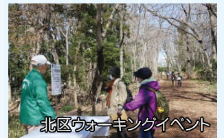
北区ウォーキングイベント