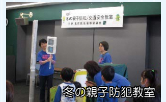
冬の親子防犯教室