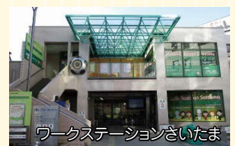
ワークステーションさいたま

目標 ワークステーションさいたま運営事業等に係る就職者数 286人 地域若者サポートステーションさいたま就職等進路決定者数 96人