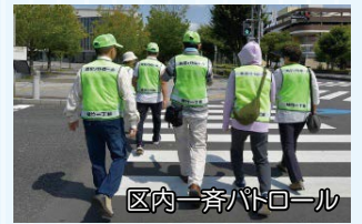
区内一斉パトロール