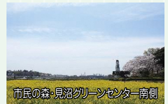
市民の森・見沼グリーンセンター南側