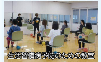
生活習慣病予防のための教室