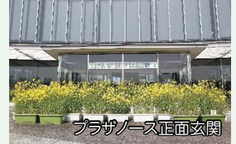
プラザノース正面玄関