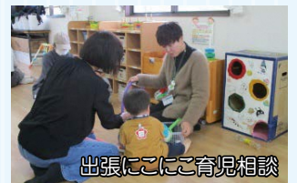
出張にこにこ育児相談