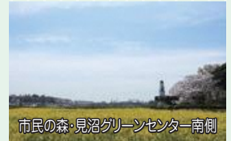
市民の森・見沼グリーンセンター南側