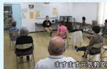
ますます元気教室