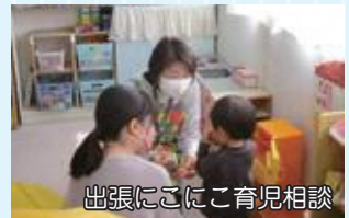
出張にこここ育児相談