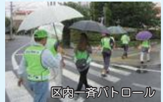
区内一斉パトロール