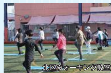
北区ウォーキング教室