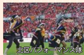
北区パフォーマンス隊