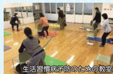
生活習慣病予防のための教室

目標 教室を合計7回開催、アンケートで「役立った」が95% 体組成計測定会3回開催 参加者数60人