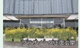
プラザノース正面玄関