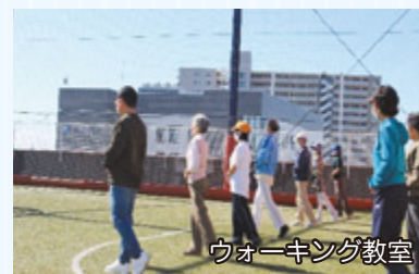
ウォーキング教室