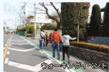
ウォーキングイベント