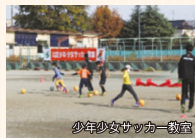
少年少女サッカー教室

団体間のゆるやかなネットワークを図るため、交流会を開催します。また、広報紙を発行し、団体の活動内容をPRします。