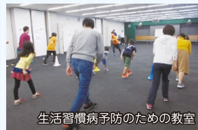
生活習慣病予防のための教室

目標 教室を合計7回開催、アンケートで「役立った」が95% 体組成計測定会3回開催 参加者数60人