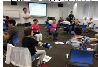
いきいき百歳体操実践中