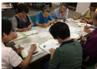
地域資源のグループワーク