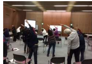
準備・整理体操実践中